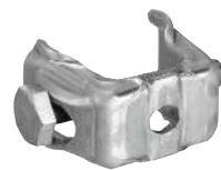
KS バグリップ直交型